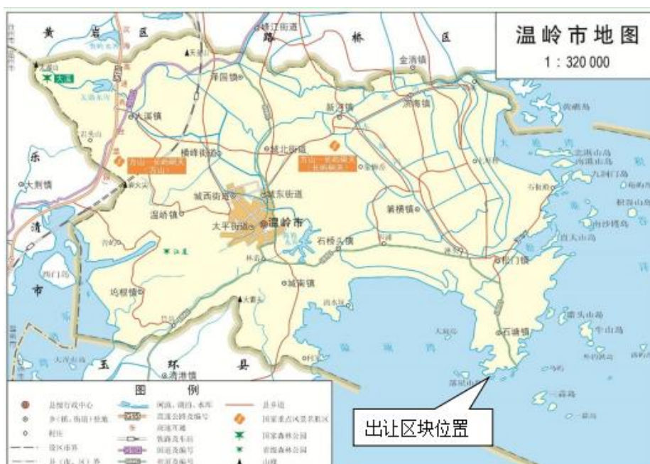
图1 出让区块地理位置图

1、出让标的：温岭市2023-3区块海域使用权。出让区块位于温岭市石塘镇棺材屿西侧，宗海面积为0.4687公顷，地理中心位置坐标为东经121°35'21"，北纬28°14'47"。码头西北距温岭市城区约30km，与温岭中心渔港石塘港区相邻。见图1地理位置图、图2出让区块范围。