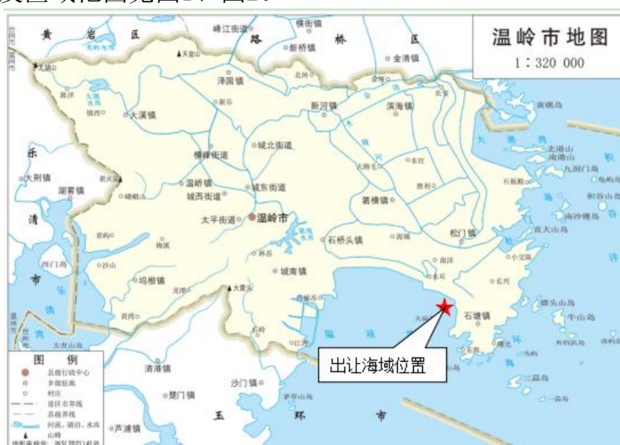
图 1 出让海域地理位置图

1、出让标的：温岭市2023-1海域位于苍山门外塘海域，宗海面积198.1989公顷，距离温岭市区约25km。养殖用海区域东临温岭市上马工业区，西侧为隘顽湾滩涂，北面为已出让的温岭市苍山门海域，南面临海。地理位置及区域范围见图1、图2。